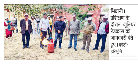
भिवानी। प्रशिक्षण के दौरान जूनियर रेडक्रास को जानकारी देते हुए।