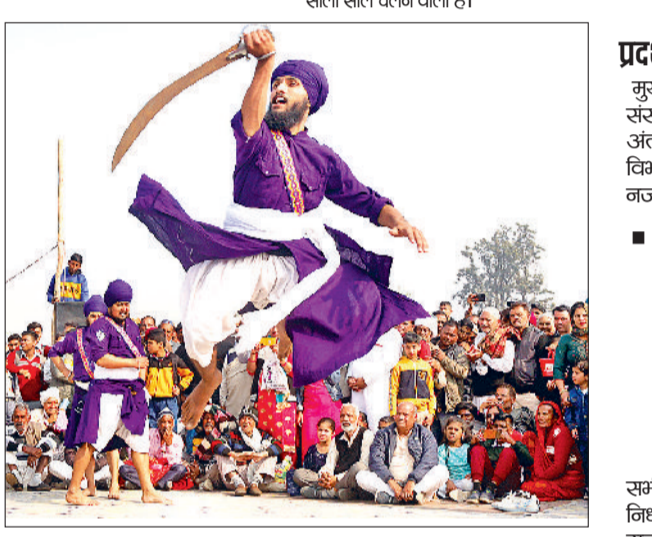
कुरुक्षेत्र। प्रस्तुति देते गतका पार्टी के सिख।