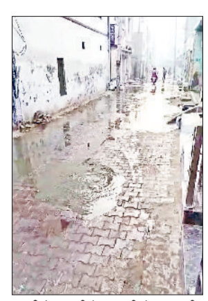
बवानीखेड़ा। गली में भरी सीवरेज का पानी।