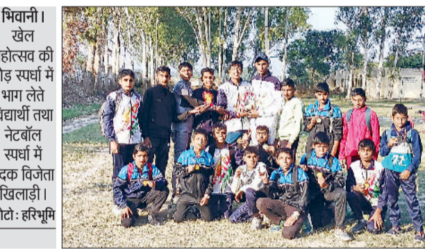
भिवानी। खेल महोत्सव की दौड़ स्पर्धा में भाग लेते विद्यार्थी तथा नेटबॉल स्पर्धा में पदक विजेता खिलाड़ी।