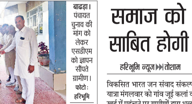
बाढ़ड़ा। पंचायत चुनाव की मांग को लेकर एसडीएम को ज्ञापन सौंपते ग्रामीण।