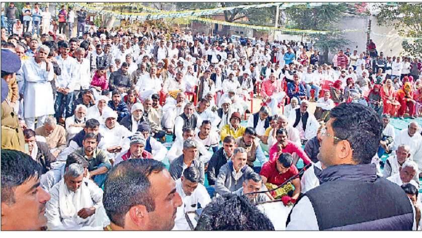
लोहारू। लोहारू में एकत्रित लोगों को संबोधित करते डिप्टी सीएम।

उप मुख्यमंत्री मंगलवार को गांव कालोद, सुरपुरा खुर्द, बैराण और सिंधानी में भी ग्रामीणों को संबोधित कर रहे थे। उन्होंने ग्रामीणों की समस्याएं भी सुनीं। डिप्टी सीएम ने कहा कि सरकार हर वर्ग के कल्याण के लिए योजनाएं लागू कर रही है। सरकार ने