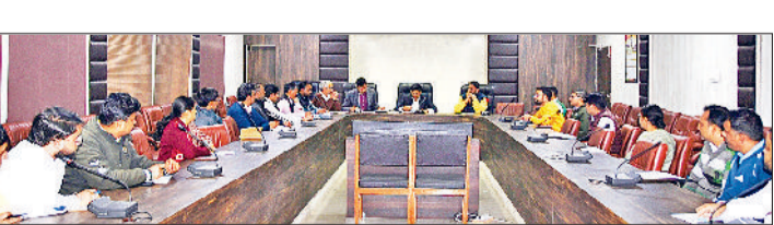
भिवानी। अधिकारियों को दिशा निर्देश देते हुए।