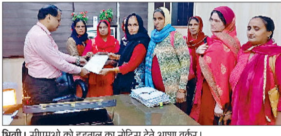
भिवी। सीएमओ को हड़ताल का नोटिस देते आशा वर्कर।